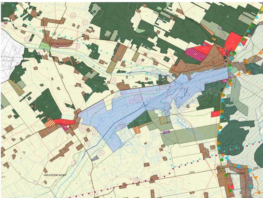
Rys. 1. Fragment I koncepcji SUIKZP (kierunki) lokalizacji zbiornika retencyjnego wraz z polderem zalewowym

Mieszkańcy Gminy Hanna oraz pozostali goście przybyli w ramach trwających dożynek gminnych, podchodzili pojedynczo lub grupami do stanowiska z mapami. Przede wszystkim interesowali się wrysowaną koncepcją budowy zbiornika retencyjnego wraz z polderami zalewowymi oraz terenami możliwymi do zalesienia i zabudowy lotniskowej.